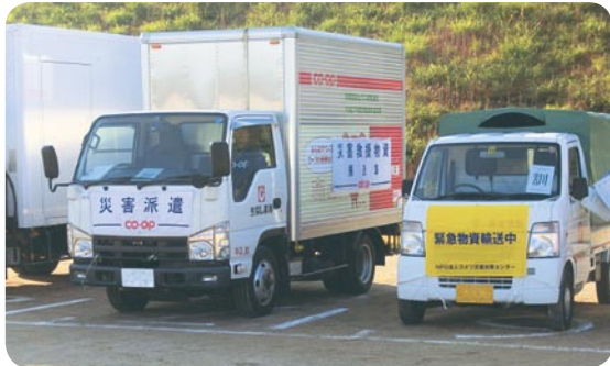
【島根県総合防災訓練】