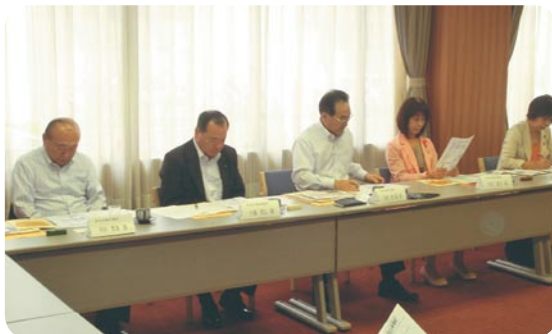
【島根県議会議員懇談会】