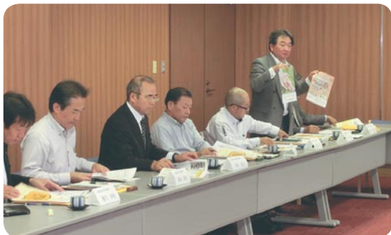
【島根県議会議員懇談会】