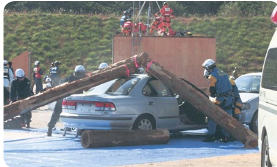
【島根県総合防災訓練】