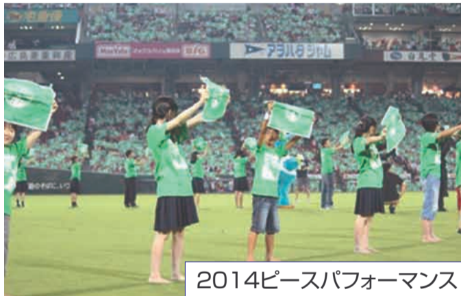
2014ピースパフォーマンス